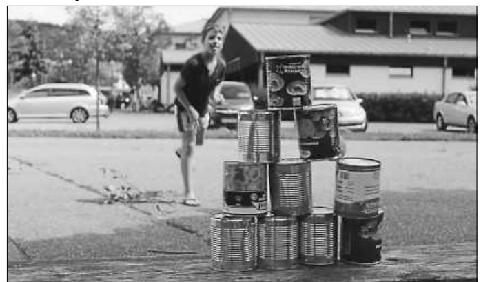
Nicht nur beim Dosenwerfen konnten die Kinder letztes Jahr ihre Geschicklichkeit beweisen...