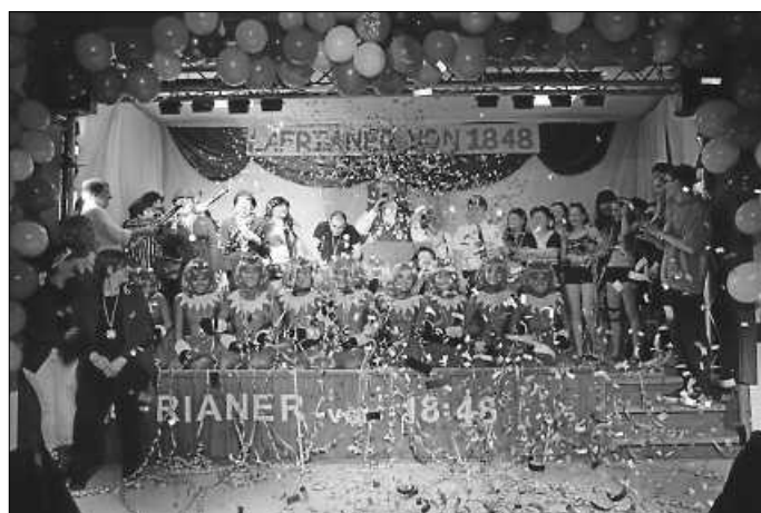
Finale beim Lafrischoppen 2019