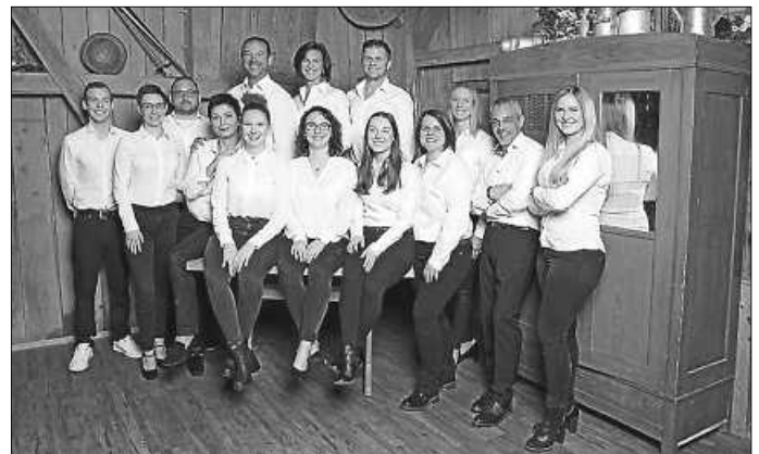
Elferrat Fasnachts-Club Sexau (es fehlt Michael Hunzinger)